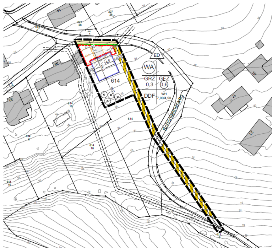
Geltungsbereich (nicht maßstabsgetreu)

Der Ausschuss für Stadtentwicklung und Mobilität der Stadt Passau hat in seiner Sitzung am 04.06.2024 die Einleitung des o.a. Verfahrens beschlossen. Mit der Änderung des o. g. Bebauungsplans soll angrenzend an das Allgemeine Wohngebiet eine weitere Bauparzelle auf der Fl. Nr. 614, Gmkg. Haidenhof ermöglicht werden. Der Geltungsbereich umfasst jeweils Teilflächen der Fl. Nrn. 614, 611, 611/6 und 615/2, jeweils der Gemarkung Haidenhof.